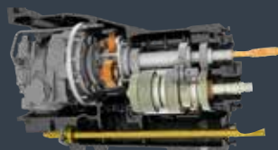
Stufenloses Getriebe von 0 bis 50 km/h