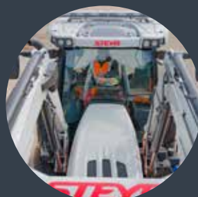
Frontladerlösungen ab Werk