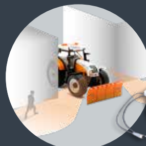
Querkamerasystem QKMS als Option