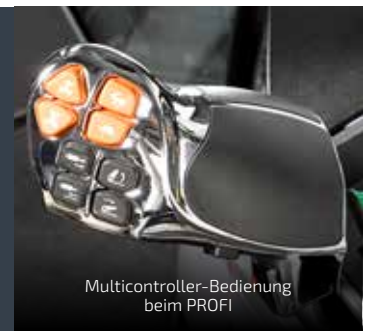
Multicontroller-Bedienung beim PROFI