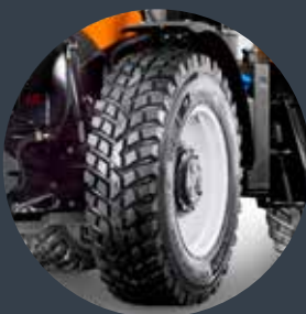
NOKIAN Spezialbereifung ab Werk